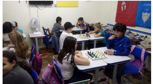
Flagrante dos alunos, durante a Oficina de xadrez