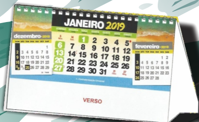
CALENDÁRIO DE MESA