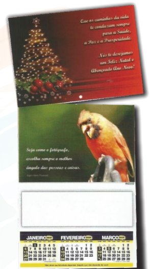
CARTÃO DE NATAL CALENDÁRIO